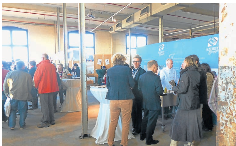
Die eingehende Beratung durch Profis ist nur ein Plus der Messe.