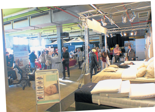
Die Aussteller sind mit Infos aber auch Anschauungsobjekten vor Ort.