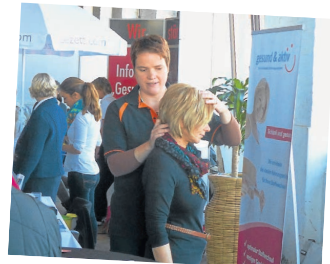
Verschiedene Entspannungsmethoden werden am Wochenende ebenfalls eine wichtige Rolle spielen.